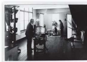
常盤台写真場スタジオ写真